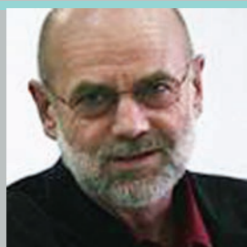
Předseda / Chairman: Mgr. Jan Ruml