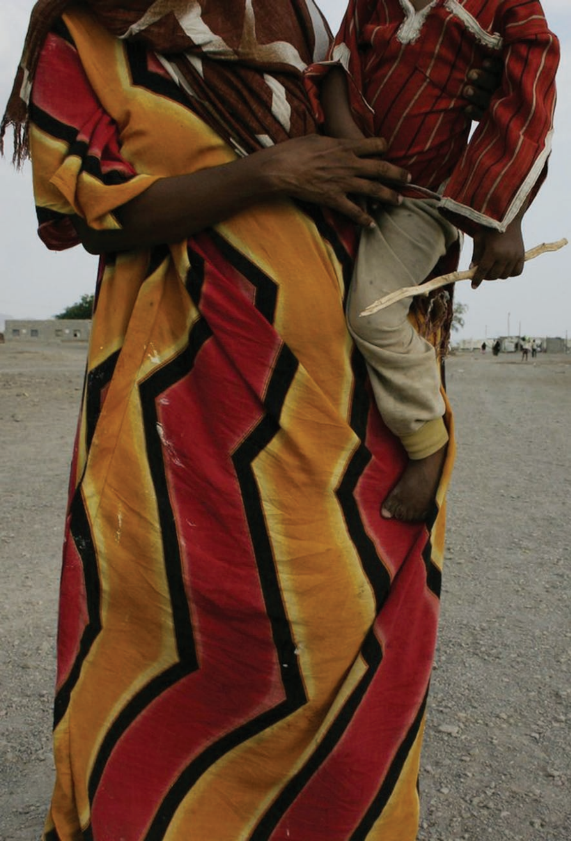
Graphic design: Nikola Hronková, corrections: Ludmila Chuchmová, 2008